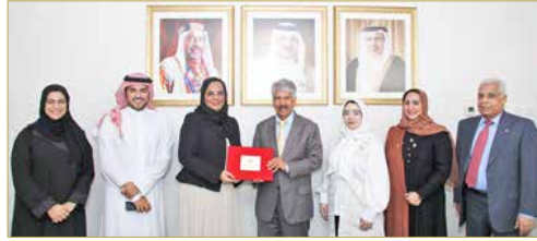
ضاحية السيف - المؤسسة الملكية للأعمال الإنسانية